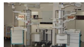
Salle de déchoquage.

A noter, l'ouverture de l'unité de soins intensifs neuro-vasculaire, prévue en janvier 2016.