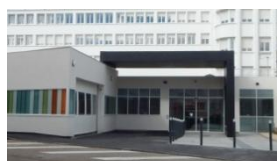
Entrée via la rue de l'hôpital.

Les urgences bénéficient désormais de deux salles d'examen supplémentaires côté « couché », et 3 salles côté « debout » en secteur de traumatologie fonctionnelle. Une salle d'attente et une salle d'examen ont été aménagées pour les enfants. Une salle de déchoquage exclusivement réservée à l'urgence vitale, équipée des matériels les plus modernes a également été créée.